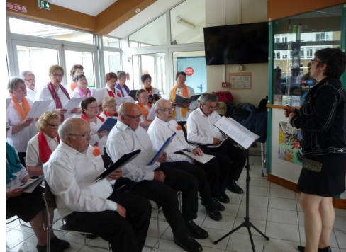
« LA GAMME au Centre Gallouédec à Parigné l'Evêque

La Gamme, c'est la chorale de notre groupe des aphasiques du Maine. Elle existe depuis 12 ans. C'est notre porte-voix pour se faire connaître du grand public.